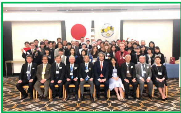
ロータリー クリスマスパーティー