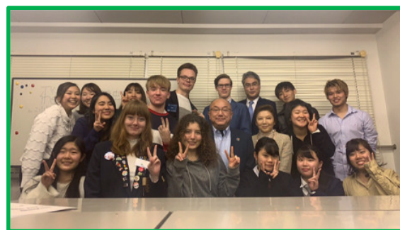
ロータリーの留学生のオリエンテーション