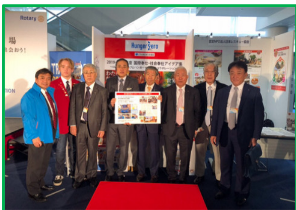
ハンガーゼロブースで手伝う