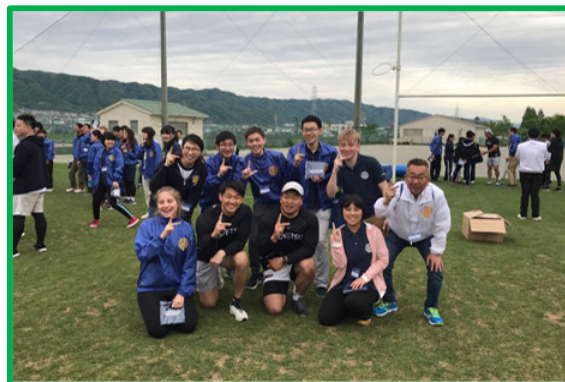
RYLA イベント チーム 5 番