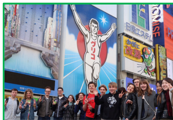
他の地区の留学生たちと一緒に難波に行った