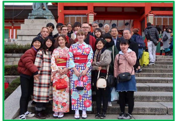
留学生たちと一緒に京都に行った