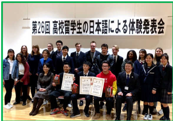
高校留学生の日本語のスピーチコンテスト